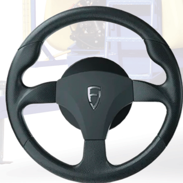
Электропривод и руль

Устройство подходит для различных моделей агрокультурной техники и всех видов работы в поле.